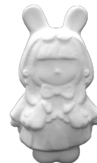
しんしゅうなかのちゃん