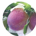
プラム・プルーン